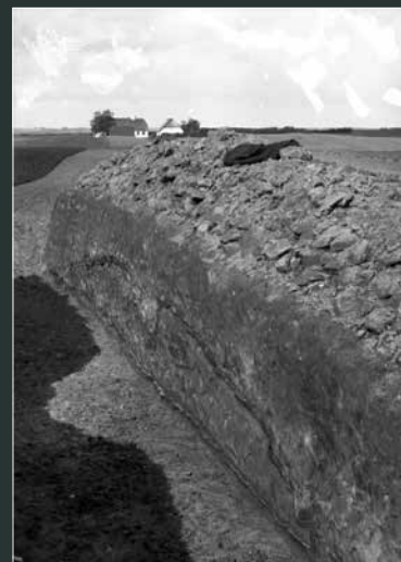
Profilsnit af højen. Alkappen ses tydeligt som et gennemgående mørkt lag i højen.