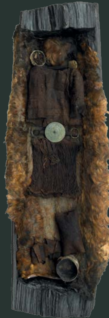
Egtvedpigen i sin kiste med gravgaver. Ingen knogler er bevaret, men håret ses tydeligt, rødt efter tiden i jorden.

Da den markante høj var blevet rejst over Egtvedpigens kiste, kom hun til at indgå i en kollektiv hukommelse i landskabet: en synlig påmindelse om de døde, forfædrene og fortiden.