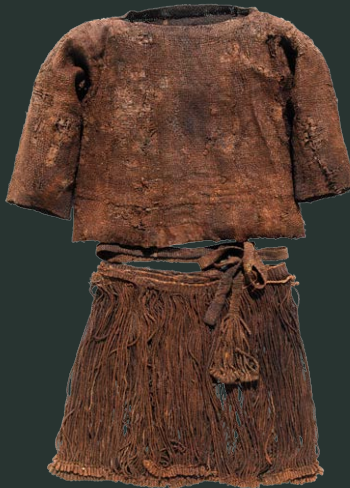
Dragten bestående af bluse, bælte og snoreskørt. (Nationalmuseet)

Snoreskørtet er et nemt lille håndarbejde, der ikke har været nær så tidskrævende som de store vævede stykker stof. Vi kender snoreskørtet fra flere fund fra bronzealderen. Der findes flere små figurer af bronze fra samme periode, der er iklædt lignende snoreskørt, såvel som der findes snoreskørt i andre egekestegre.