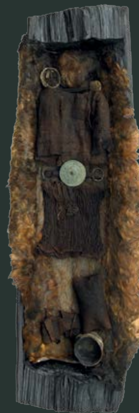
Egekiesten med indhold. I hovedenden, ved pigens ansigt, ses den ovale barkspand med gravgaver

Den unge kvinde og barnet kan have været beslægtede, men det er næppe sandsynligt, at de var mor og barn. Hvorfor barnet er brændt er svært at svare på, men den omhyggelige anbringelse af benene i barkkassen og i tøjbylten tyder på en særlig rituel handling. Måske er der tale om et offer? Hvorfor pigens og barnets døde, ved vi ikke, men det har været vigtigt, at de fik en særlig begravelse.