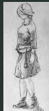
Egtvedpigen skitseret af konservator G. Rosenberg, 1924.

Øverst ses et koskind og under det skimtes noget uldent tøj. I det ene hjørne står en velbevaret spand af birkebark. Kistens inderside er dækket af et hvidt lag. Det er ligfedt, som har afsat sig på træet.