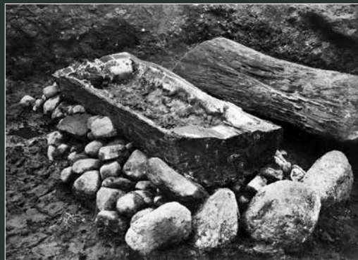
Kisten efter låget er løftet af. Under koskindet anes svagt en skikkelse. (Nationalmuseet).