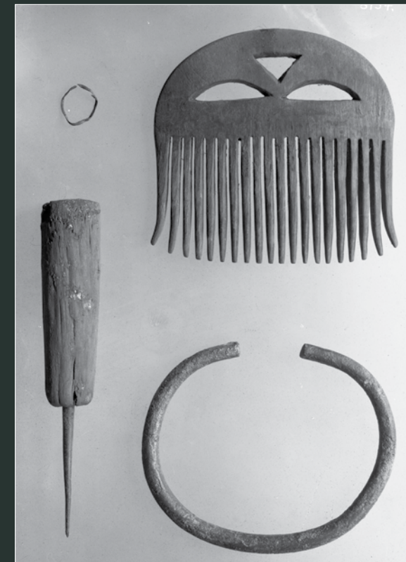
Sylen af bronze med træskaft. Et meget nyttigt redskab og uundværlig for den, der arbejder i træ, læder, ben og bark. Kammen er et smykke og en nyttegenstand, udskåret af kohorn. Den har sandsynligvis været fastgjort til bæltet med et bastbånd. Smykker. Ud over bæltepladen havde Egtvedpigens også sine armringer og ørering med i graven.