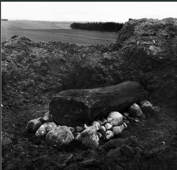
Kisten på sin stenlægning som den blev fundet i 1921, inden låget løftes.