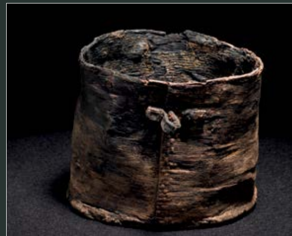
Barkspand af birkebark. I fodenden af kisten fandtes en barkspand med resterne af en drik bundfældet. Analyser har vist, at det var en alkoholisk drik gæret på hvede, bær og pors, sødet med honning.

Bæltepladens dekoration består skiftevis af spiraler, perlebånd og zig-zag-linjer. Bronzestøberens, som nok også har lavet hendes brede armbånd, har imidlertid ikke været blandt fagets dygtigste udøvere. Hans arbejde er ikke særlig præcist lavet.