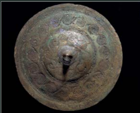
Bæltepladen af bronze. Mønstret er tidstypisk for Ældre Bronzealders periode II. Arbejdet er en anelse upræcist og bæltepladen derfor ikke af den allerfineste kvalitet. (Nationalmuseet)